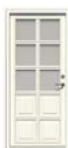
Facadedør med glas