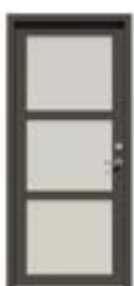
Facadedør med glas